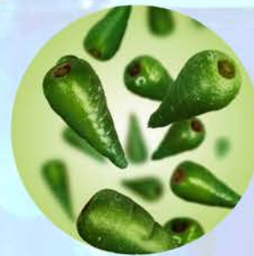
TURMERIA ZEN PRCF

ザクロ幹細胞由来のポリフェノール 抗酸化・MITF抑制・メラニン合成抑制と相乗的なブライティングアプローチができます。