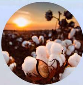
LUMINIA GRANATUM PRCF

ザクロ幹細胞由来のポリフェノール 抗酸化・MITF抑制・メラニン合成抑制と相乗的なブライティングアプローチができます。